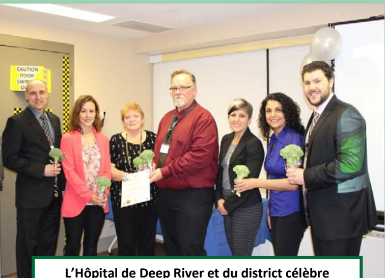
L'Hôpital de Deep River et du district célèbre l'atteinte du niveau argent, mai 2017 Lisez l'article publié dans le Daily Observer (en anglais) pour en savoir plus!