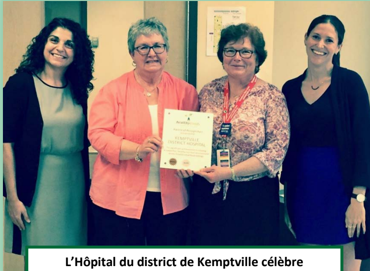
L'Hôpital du district de Kemptville célèbre l'atteinte du niveau argent, juin 2017 Lisez l'article publié dans Inside Ottawa Valley pour en savoir plus!